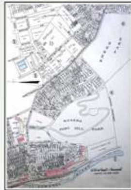
Atlas of the City of Lowell, 1924

Where Wannalancet's seventeenth-century palisade fort once stood, Rogers Fort Hill Park was established in 1886, on the site of the Rogers family farm. The formal paths and fountains of the park's lower portion were designed by the Olmsted firm and completed decades later.