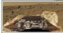
Beadford Industries of Lowell was chosen by NASA to develop the airbag material which cushioned the shock of the Pathfinder's landing on the rocky surface of Mars on July 4, 1997. This was the first man-made material ever to touch the surface of the planet. (photo left)

"The Portuguese always kept their homes very neat and clean. They had all different kinds of flowers, of course, but they also had grapevines, and they'd have the arches."