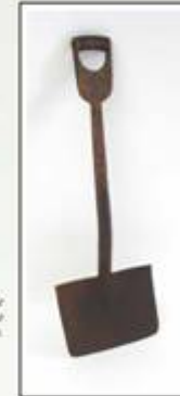
The 1624 shovel is similar to tools made in the early nineteenth century by the Ames and Fisher iron works.