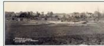
On July 28, 1901, two powder magazines exploded at the U.S. Cartridge Company, located at the north end of the Wamesit Canal. Twenty-five workers died, gunpowder at the factory were knocked over, and houses as far as a mile away were damaged.