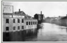
The 1913 photograph, looking upstream from East Merrimack Street, shows the remnants of another era. The Dillon Day Works, to the left, is now part of the Middlesex Community College campus. The Middlesex Manufacturing Company building, looming in the distance, was razed in 1956 to make way for a parking garage.

Until the mid-twentieth century, there was an island in the Concord River, downstream from Middlesex Falls, that provided two good fishing places at either end. Wamessit Indians and early white settlers caught shad, alewife, eel, and salmon there in great quantities, before dams and pollution decimated fish stocks.