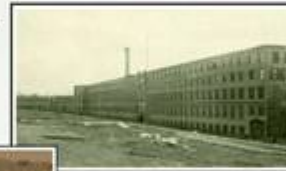
American Hide and Leather, located on the site now occupied by Beadford Industries, was one of the largest tanneries in the United States. It closed in 1956, and the buildings were destroyed by fire in the 1980s. (photo right)

The Lowell & Andover Railroad was completed in 1874, branching off from the Boston & Maine below Lawrence Street and traveling a short path on what is now the Concord River Greenway. With this rail access, Perry Street finally saw the arrival of business and trade.