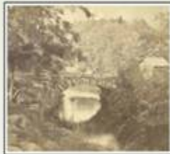
Built in 1846, this bridge brought visitors to the Lowell Cemetery's Lawrence Street entrance.

The Lowell Cemetery is one of the oldest "garden" cemeteries in the United States. Established in 1841, it was meant to be a burial ground for the dead and a park-like retreat for the living.