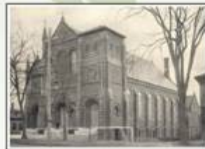
Many Irish Catholics belonged to the Sacred Heart Parish and attended the church on Moore Street, built in 1894.

Water-powered manufacturing started early on the lower Concord River. Here, eighteenth-century settlers built numerous dams and mills to saw lumber, grind grain, and card wool. In 1818, Moses Hale erected several buildings at Wamesit Falls to make gunpowder.