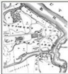
Plan of Farms ... at Pawtucket, 1621 This area, formerly East Chelmsford, was sparsely populated when Boston investors purchased Nathan Tyler's farmland to start textile production here.

Drawing on centuries of tradition, native inhabitants used the land along the Concord River to cultivate corn, beans, and squash together in the same field. Beans restored soil fertility, squash leaves shaded the ground, and corn stalks provided a scaffold for beans. Plant diversity also minimized the threat of insect pests.