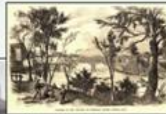
These two images of the Concord River show its confluence with the Merrimack River. The image following from stacks along the "side of mills," pictured in both the undated engraving and the 1908 photograph, now symbolizes Lowell's prosperity.

Constructed in 1793 to facilitate the movement of people and goods around Pawtucket Falls, the Pawtucket Canal became part of an extensive power canal system used by Lowell's textile mills. This included the Massachusetts Mills, built at the Merrimack and Concord River confluence in 1841, as well as the adjacent Prescott Mills, incorporated in 1844.