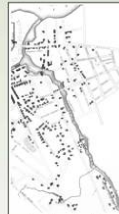
Plan of the Town of Lowell and Belvidere Village, 1832

"The parish was the center of your life. . . You went to school there. You went to church right across the street, and then you mixed in with the people up in that area."